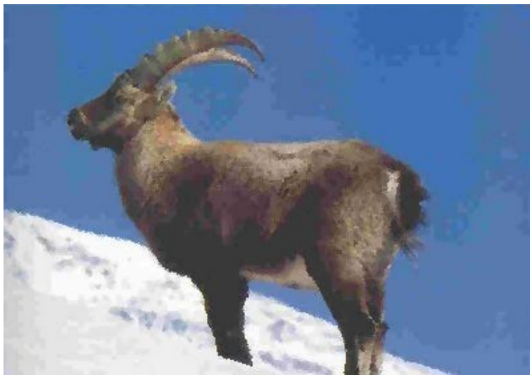
Gran Paradiso – Lo stambecco