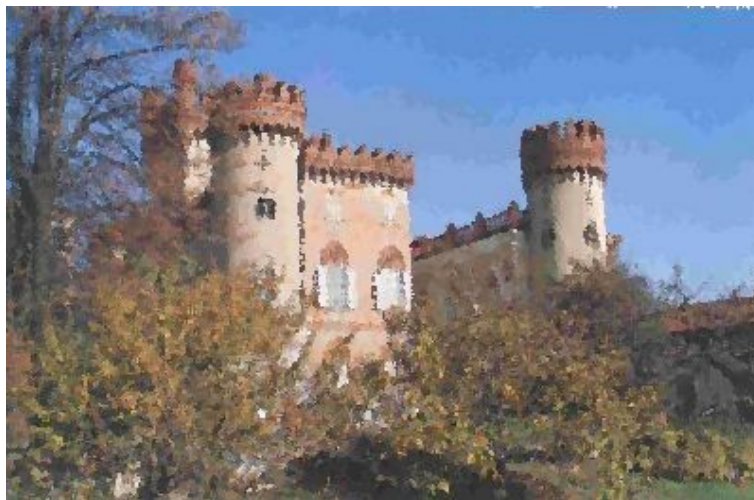
Castello di Favria