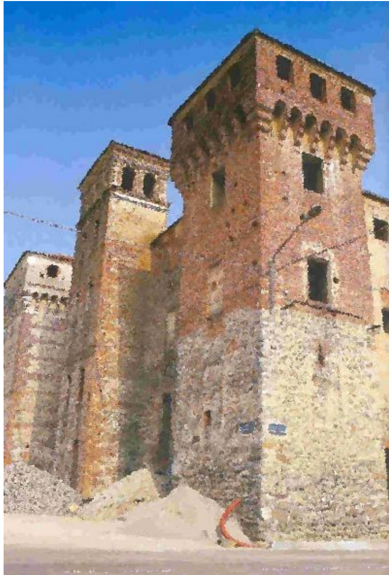
La fortezza contadina di Ozegna poi inglobata nella residenza dei Conti di Biandrate