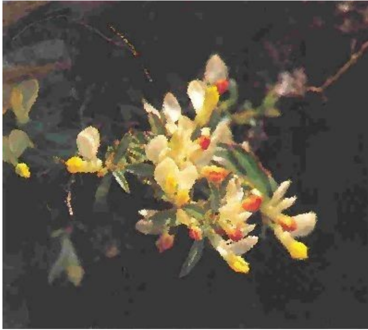
Gran Paradiso – Flora