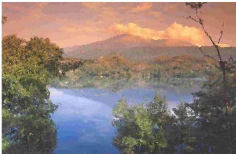
Il lago Sirio presso Ivrea